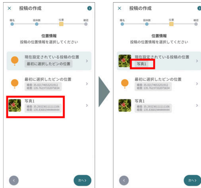
投稿の位置情報の設定 (左:「写真1」をタップする⇒右:投稿の位置情報が「写真1」の撮影場所に設定される)

示されています。設定可能な位置情報が複数ある場合は、その下にリストで表示されます。