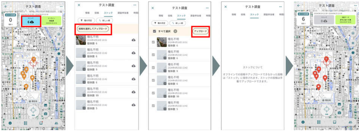
ストックの一括アップロード手順