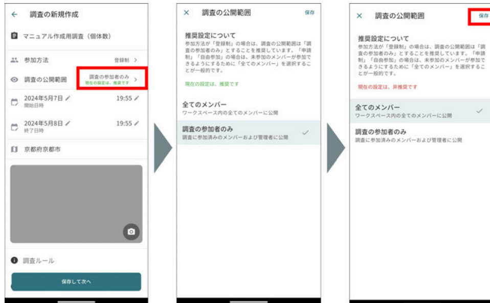
調査の公開範囲の設定

これ以外の公開範囲にしたい場合は、参加方法を設定した後に、公開範囲を手動で変更してください(この操作を行うと、注意喚起のため「現在の設定は、非推奨です」というメッセージが表示されます)