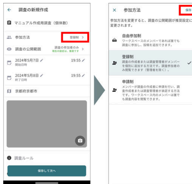
調査の参加方法の設定

参加者側からの参加申請を調査作成者とワークスペースの管理者(オーナーまたはマネージャー)が承認することで参加者が追加されます。(詳しくはマニュアルの8. 調査の参加申請を管理するを参照)