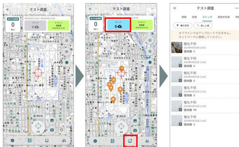
オフライン環境でのストック作成画面