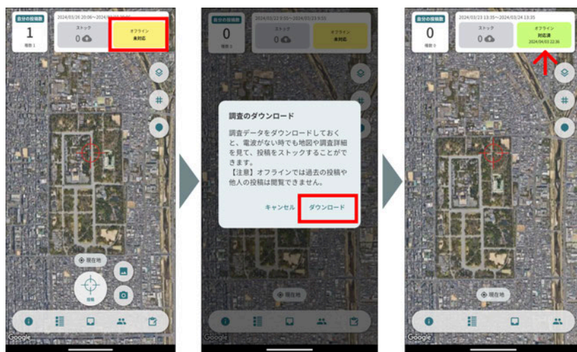
調査のダウンロードを行う手順

調査のマップ画面上の黄色いボタンをタップすると、地図をダウンロードできます（この操作はオンライン環境で行ってください）。